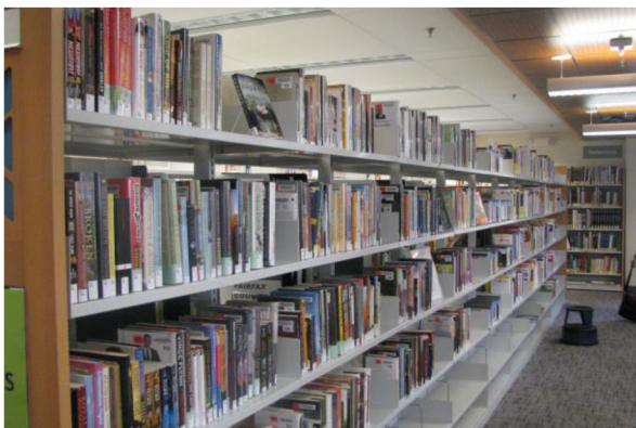
Khu vực dành cho sách tiếng Việt