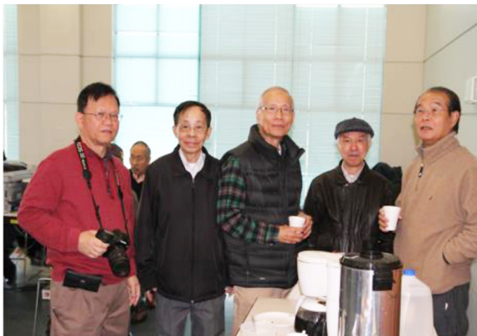
Khai thuế miễn phí 2014