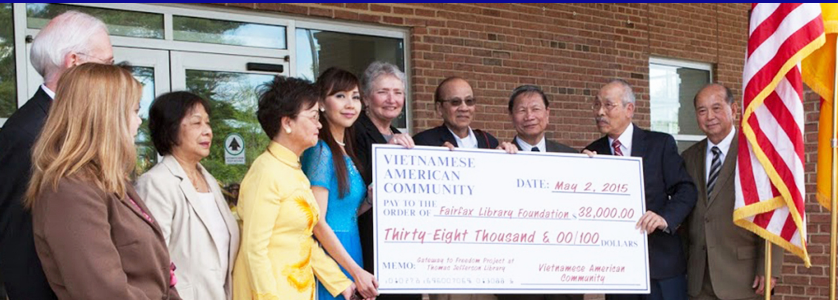
Trao quà ân nghĩa cho Thư Viện Thomas Jefferson, đánh dấu 40 năm Người Việt Tỵ Nạn Cộng sản tại Hoa Kỳ